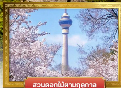
สวนดอกไม้ตามฤดูกาล