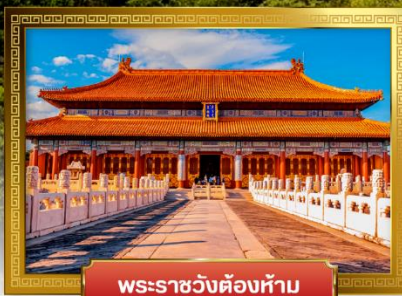
พระราชวังต้องห้าม