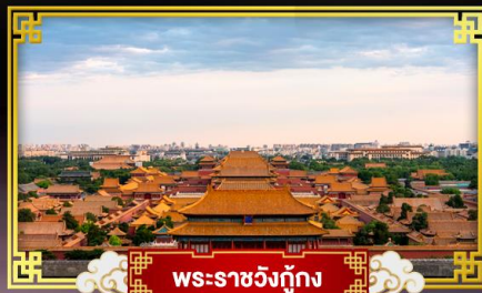
พระราชวังกู้กง