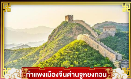
กำแพงเมืองจีนค่านู๋หยงกวน