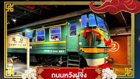
ถนนหัวงฝูเจิ้ง