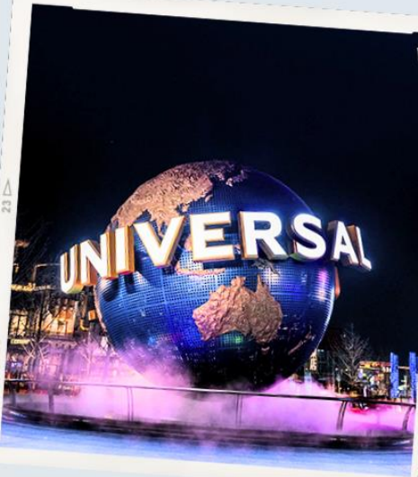
UNIVERSAL CITYWALK BEIJING